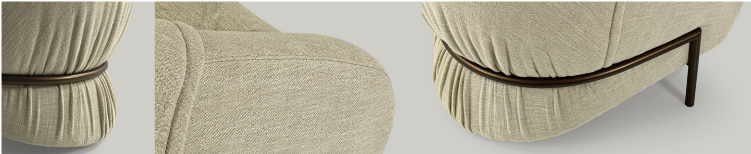
pieghe pleats plis