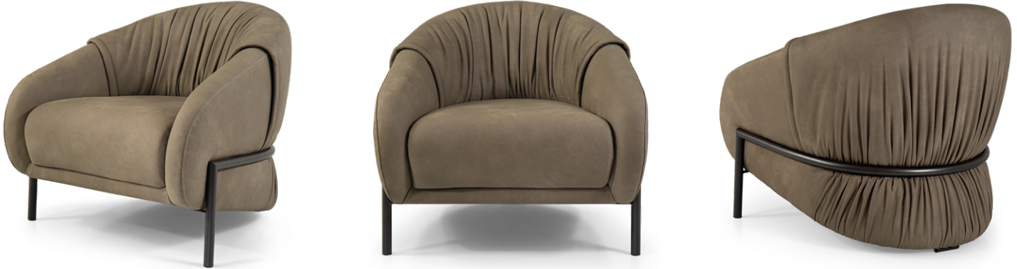
armchair 85x90 h 80 Leather art. SEQUOIA col. 4003. Metal base finish col. Vulcan Grey.