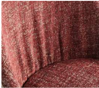
drappaggio drapery drapé