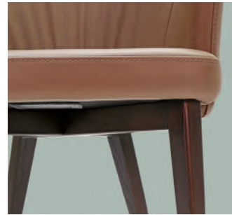
base in legno "R" "R" wooden base base en bois "R"