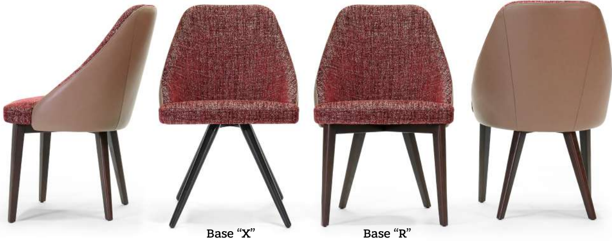
chair 55x59 h 87 / Outside-frame leather art. SETA col. 71178. Inside-frame and seat fabric art. PORTO CERVO L1571 col. 51. Thread col. 0033. Lacquered brown Oak wooden base.