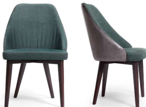
chair 55x59 h 87 / Outside-frame leather art. GHOST col. 35. Inside-frame and seat fabric art. ASOLO L1569 col. 12. Lacquered Brown Oak wooden base.

Consulta i legni Discover the woods Consultez les bois