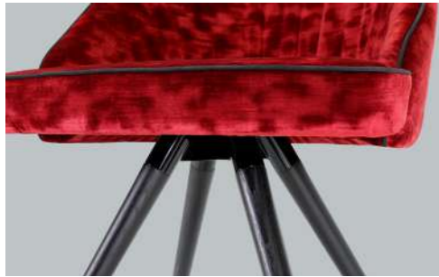
base in legno "X" "X" wooden base base en bois "X"