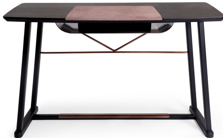
desk 130x70 h 76 / Lacquered black Oak wooden top with leather Nabuk col. 82. Frame lacquered Black Oak. Metal details col. Burnished Bronze.

The Golia desk offers a contemporary look at a key element for the living room area. An elegant design that brings out the full beauty of the materials: from wood, to the natural leather on the handrest, and the metal details on the frame. All merged together in a unique alchemy.