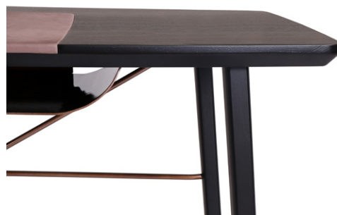
vano portadocumenti, dettagli e poggipiedi in metallo glove compartment, details and footrest in metal boîte à documents, détails et repose-pieds en métal Dokumentenfach, Details und Fußstütze aus Metall