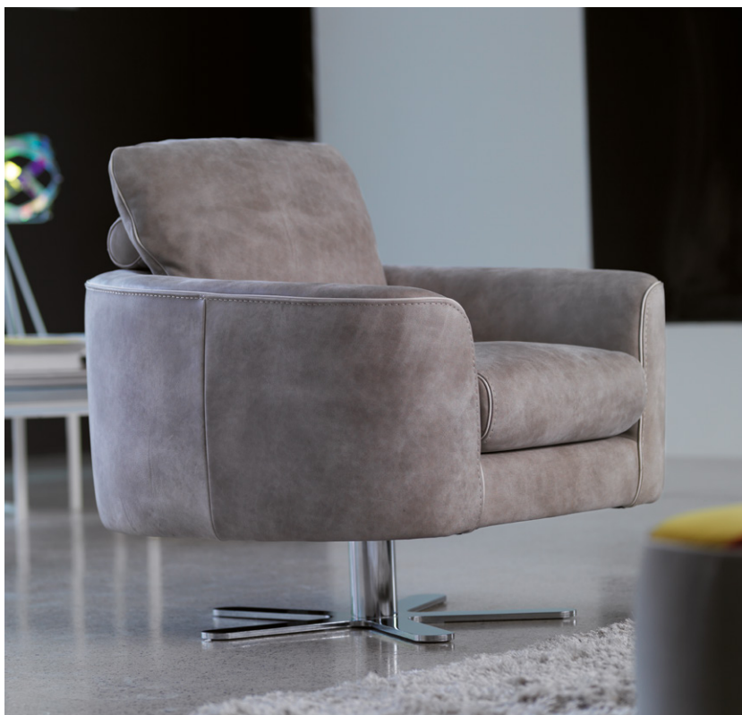
Covering: leather RUSTICO col. 10